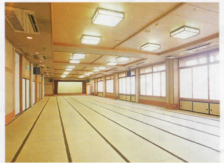
大宴会場「平安の間」